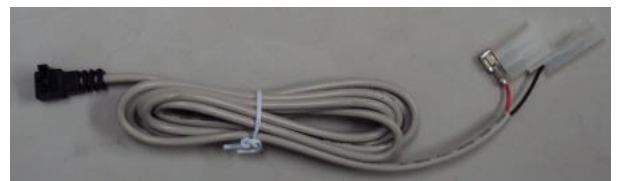
外部信号ケーブル(外部信号による再生用途)