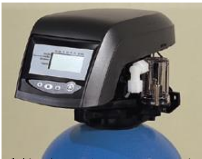
高性能デジタルタイマー(IRSC40～IRSC75 タイプ)